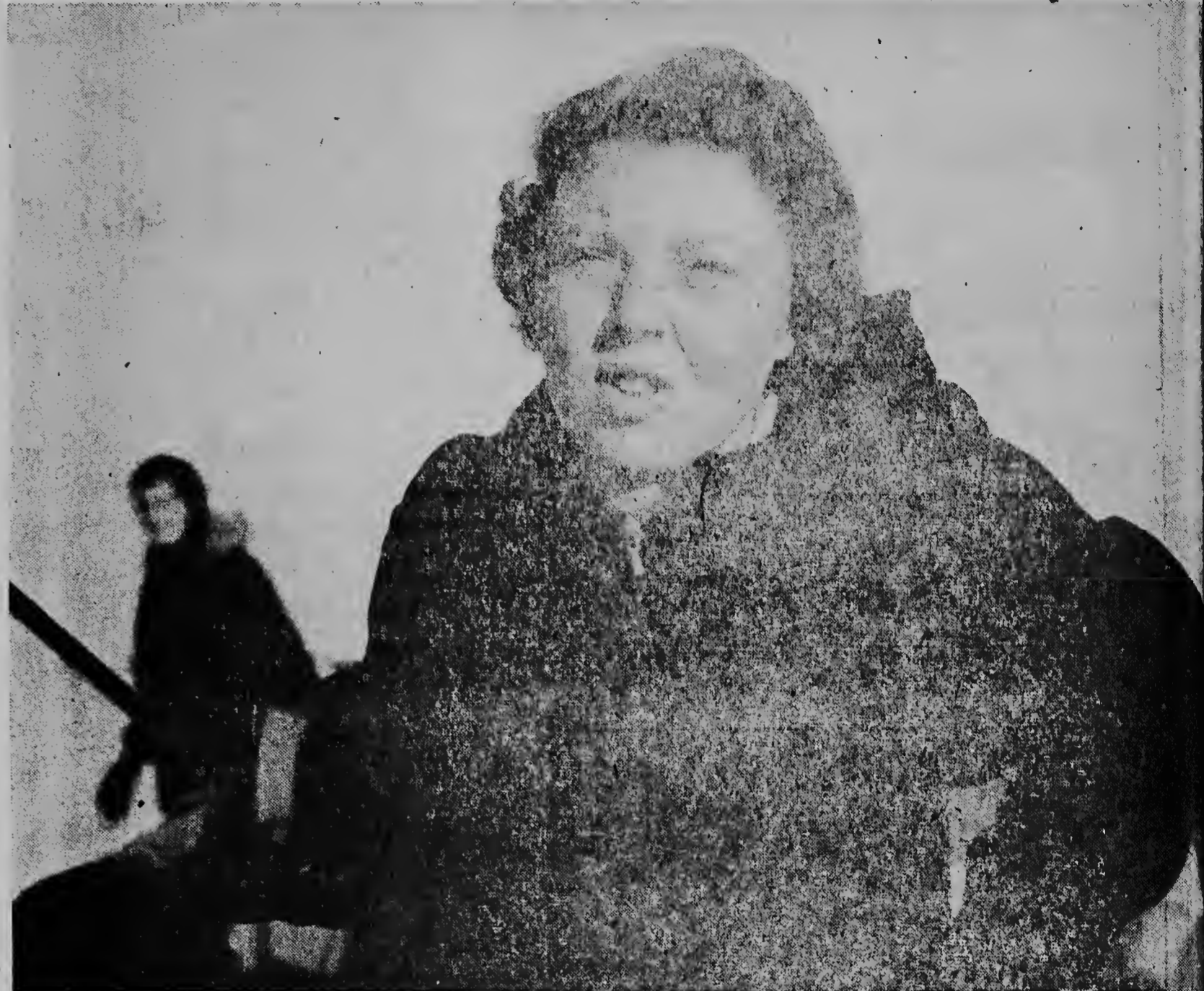
Coe sport ta un medida masha importante pa un educacion harmonioso pa habentud, e mayornan di Prinses Beatrix sa mucho linn. E prinsenan ta haa ja masha hopi ocasion pa entrenamentu di diferente ramo di sport, y Beatrix y Irene tur dos parece di tin hopi gusto pa sport. Aki nos por weita Prinses Beatrix, tempu eue e tabata eue su mayornan na 1956 na Swisa durante di sport na invierno.